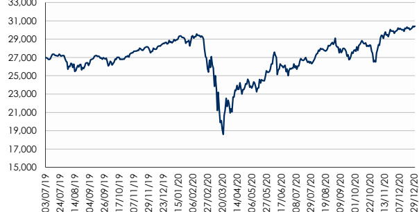
DOW JONES (DJI)